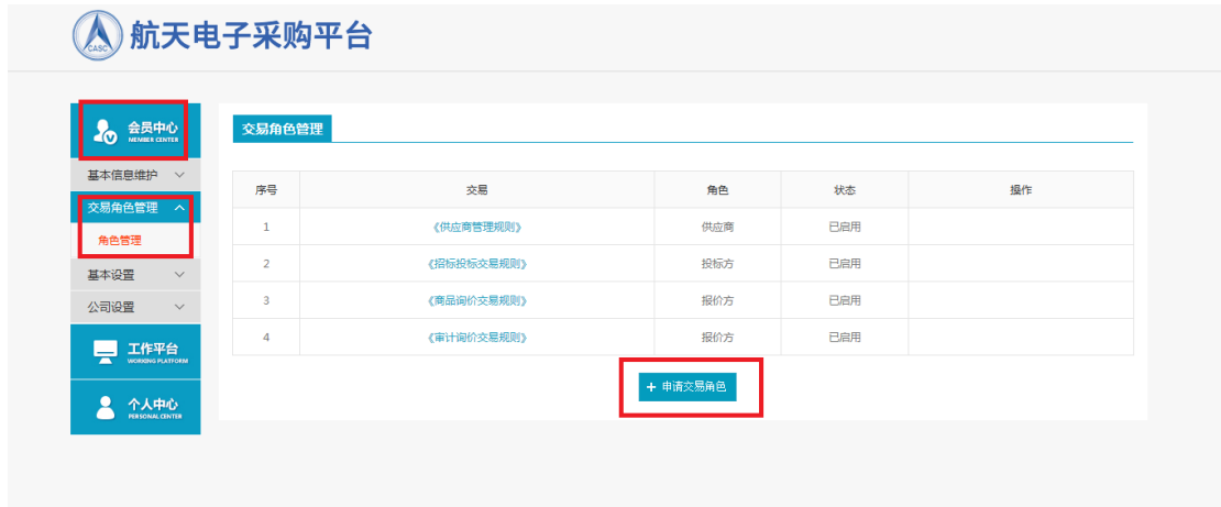
图五：交易角色页面